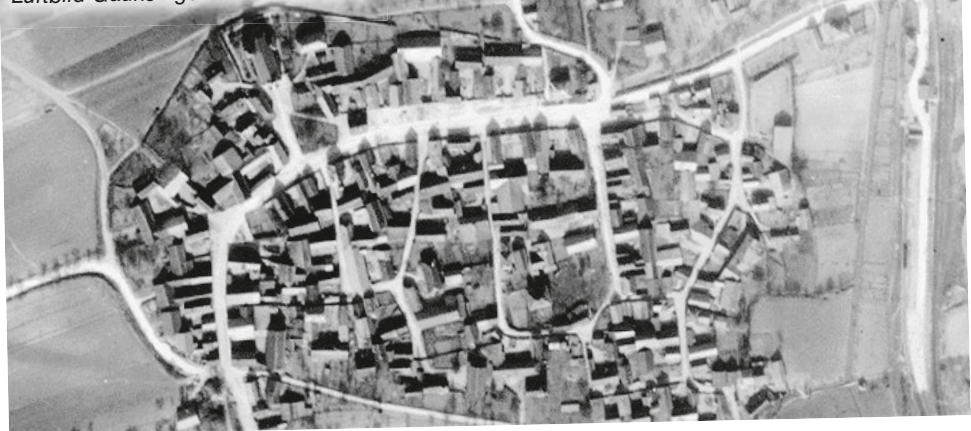
Luftbild Gaukönigshofen März 1945