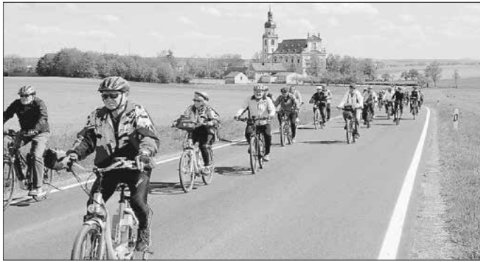
Bei der Radtour am 17. Mai können die Teilnehmerinnen und Teilnehmer gemeinsam den nördlichen Landkreis und seine Bio-Landwirtschaft erkunden. Das Bild zeigt Radfahrer bei einer früheren Tour.