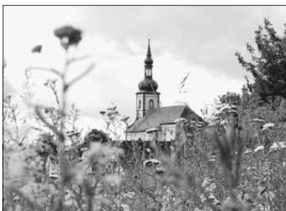
Wiese Dorfkirche

Universität Würzburg und Biodiversitätszentrum Rhön benötigen Rückmeldung Derzeit führen die Universität Würzburg und das Biodiversitätszentrum Rhön das Forschungsprojekt „Summende Dörfer“ unter Beteiligung der Öffentlichkeit durch. 20 Dörfer im Raum Main-Rhön wurden