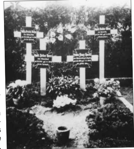
Foto der Kriegsgräber in Gaukönigshofen

und ca. 20 Mann gerieten in Kriegsgefangenschaft. Auch mehrere Scheunen am westlichen Dorfrand waren von den Panzern in Brand geschossen worden. Trotz der anhaltenden Beschießung des Dorfes rückte auch hier die Feuerwehr aus. Für die vielen Brandstellen reichten die Schlauchleitungen nicht aus. Das Löschwasser musste mit Eimerketten, hauptsächlich von Frauen, weitergebracht werden.